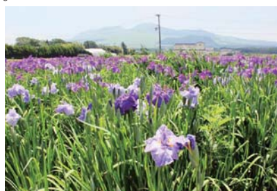
▲跡ヶ瀬シヨウブ園

シヨウブがたくさん咲く風情ある川づくりを目指し、休耕田に育成していた跡ヶ瀬シヨウブ園のシヨウブ8千株をいよいよ地域を流れる山内川に移植する運びとなりました。