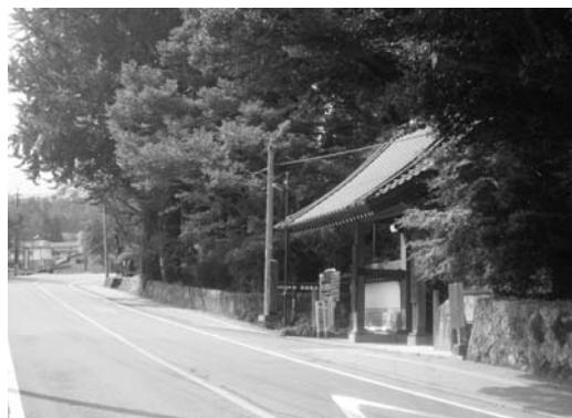
西巖殿寺前登山道路

中央病院事務局長 熊本から専門の先生をお呼びし看護師、医師、職員、全てに対して、3年前から研修を行っています。