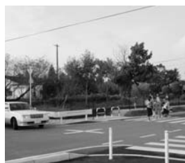
中通小学校前の交差点

農政課長 実施する団体だけでなく、観光客の方々も一緒になって支援していただき、草原を守るということで今、草原特区を提案しているところです。