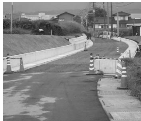
完成が待たれる五本松線

他に、「仙酔峡ロープウェイ」「国民健康保険、基金のあり方」「幹線道路からのアクセス、地場企業の活用と地元資材の活用」の質問がありました。