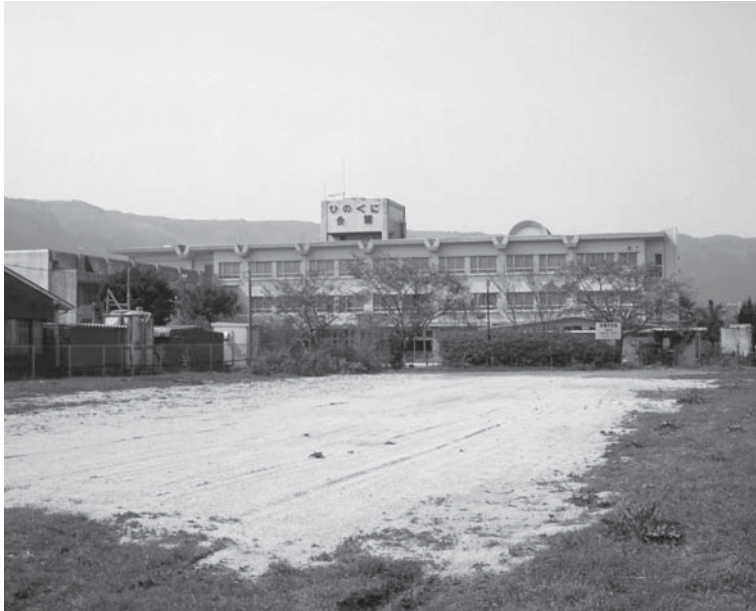
ひのくに会館駐車場

おり、おもに工事車両の 駐車です。ほかには、資 材置き場としての使用申 請もあがっております。