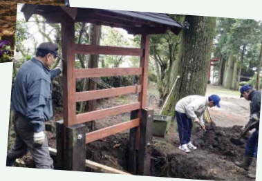
絵馬掛けの設置 (サテライト「乙姫神社」)