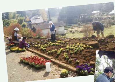
乳の木周辺の環境整備 (サテライト「乳の木」)

次回から、サテライト応援事業を活用して地域の活性化に向けて取り組んでいるサテライトを随時ご紹介していきます。