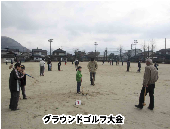
グラウンドゴルフ大会