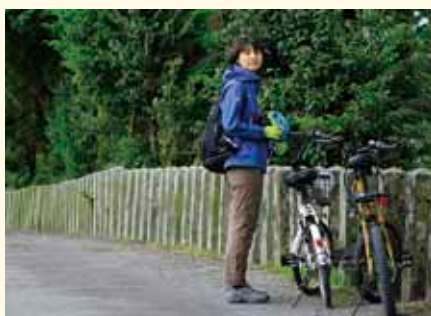
これまでは気づけなかった、阿蘇の新しい魅力を見つける素敵な旅になりました！