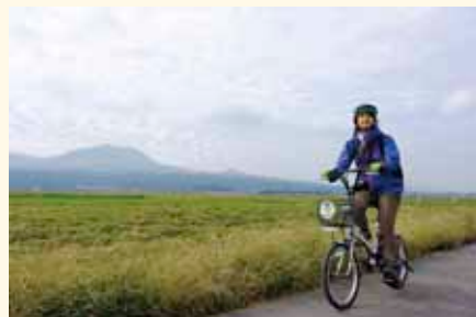
阿蘇の田園風景の中を、のんびりと楽しめるコースをマイペースに走る。