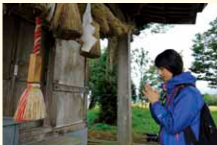
コースに点在するポイントに寄り道し、地域の魅力をじっくりと味わいます。