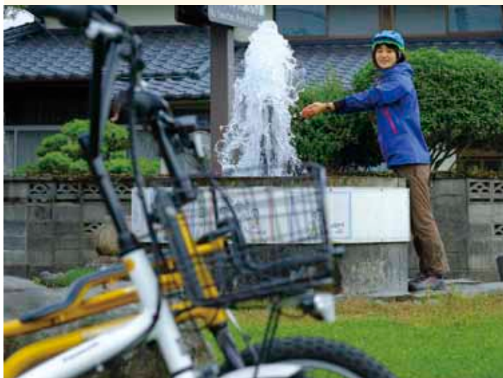
阿蘇のサイクルツーリズムなら、楽しみ方は人それぞれ。

阿蘇は豊かな自然、温泉、宿泊、食、史跡など様々な観光資源があり、九州を代表する観光地として親しまれています。阿蘇は、今サイクリストの間で注目を集めています。外輪山を望む絶景をゆっくり楽しめるルート、広々とした草地の中のアップダウンを楽しみながら走るルート、阿蘇谷全体を大パノラマで見渡せる田子山(三久保)の頂上まで急坂を登りつめるルートなど、本格派から初心者まで幅広い期待に応えられる場所です。阿蘇でしか感じることでできない魅力ある道や絶景、食を求め、多くのサイクリストが訪れ、阿蘇の恵みを存分に楽しむはじめています。