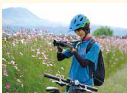
撮影ポイントでは自転車をとめて、阿蘇の四季をパチリとカメラに収めました。