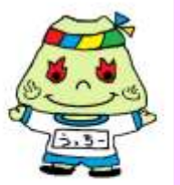
内牧小のキャラクター