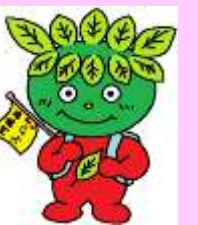
阿蘇西小のキャラクター