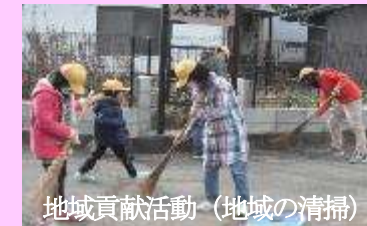
地域貢献活動(地域の清掃)

取組内容 ・地域体験活動(14地区に別れて実施) ・草泊まりと乗馬体験活動 ・大豆植えー大豆収穫ー豆腐・納豆づくり ・コマ打ち体験