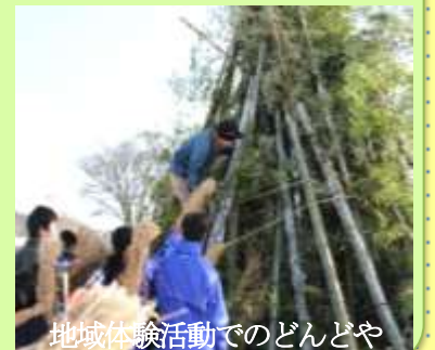
地域体験活動でのどんどや

取組内容 ・実働内容としては小中合同での取組を多く行っている。 ・小中合同運動会、合同歓迎遠足、中学校職員による小学校への乗入れ授業など ・夏と冬2回の「小中合同地域体験活動」では、地域の方や保護者、学校職員、児童生徒と一緒に地域探検やどんどや、郷土料理、地域行事を行っている。 ◆まだまだ、コミュニティ・スクールの認識や内容についての理解が浅いため、広報活動や協議を積み重ね、地域が一体となった組織づくりを行っていききたい。 ◆地域の宝である波野の児童生徒と一緒に育てていきましょう。そのためにも、地域住民・保護者の皆様のご協力をよろしくお願いいたします。