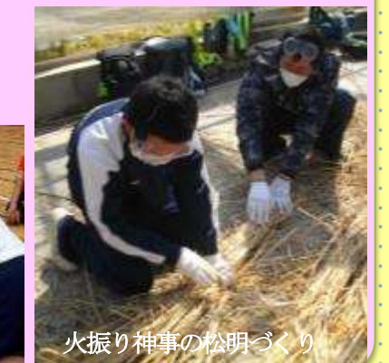
火振り神事の松明づくり