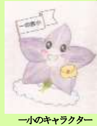
一ノのキャラクター

構成員 阿蘇市商工会副会長、一の宮地区区長代表、宮地分館長兼総括コーディネーター、坂梨分館長兼コーディネーター、古城分館長兼コーディネーター、中通分館長兼コーディネーター、民生委員代表、一の宮中学校校長、放課後子ども教室コーディネーター、放課後子ども教室安全管理員、宮地保育園園長兼まどか学童クラブ長、VOICE MC代表、PTA会長、PTA副会長、一の宮小学校校長