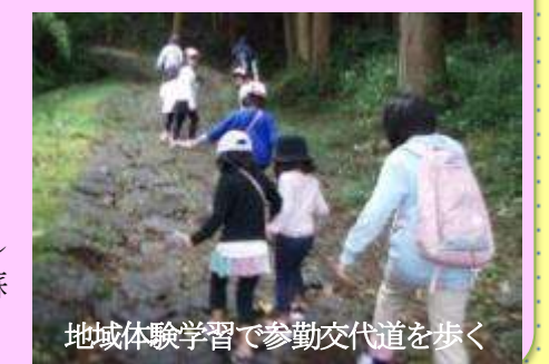
地域体験学習で参勤交代道を歩く

◆2年間の準備期間を経て、今年度より、コミュニティ・スクールとしてスタートしました。学校・家庭・地域がそれぞれ役割を分担しながら、共有目標に向けて阿蘇西っ子を育てていきます。 ※学校支援ボランティア・・・現在募集中です!