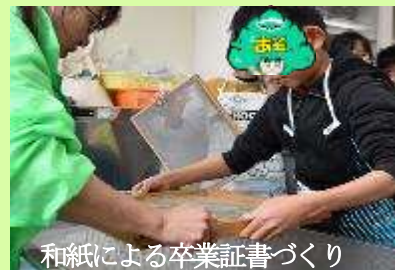
和紙による卒業証書づくり