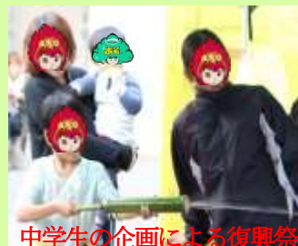
中学生の企画による復興祭