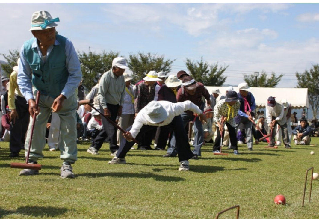
シルバースポーツ大会