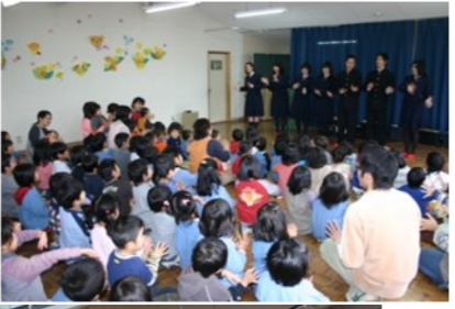
高校生によるおはなしボランティア