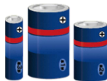
乾電池（充電式を除く）