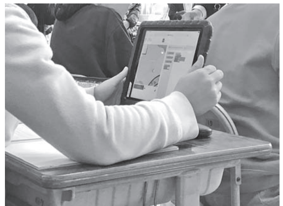
小中学校情報通信ネットワーク構築事業 （タブレット端末を使った授業）