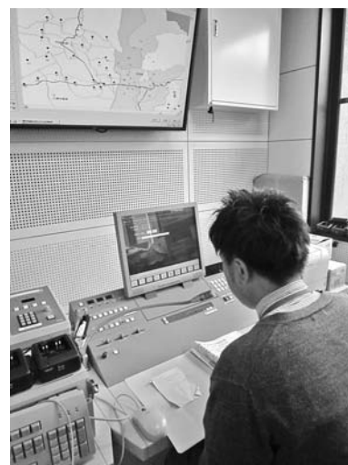
防災行政無線 操作卓