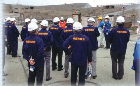
阿蘇山上一帯現地視察