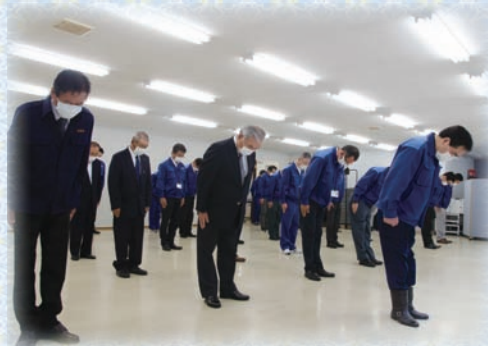
九州北部豪雨災害追悼行事