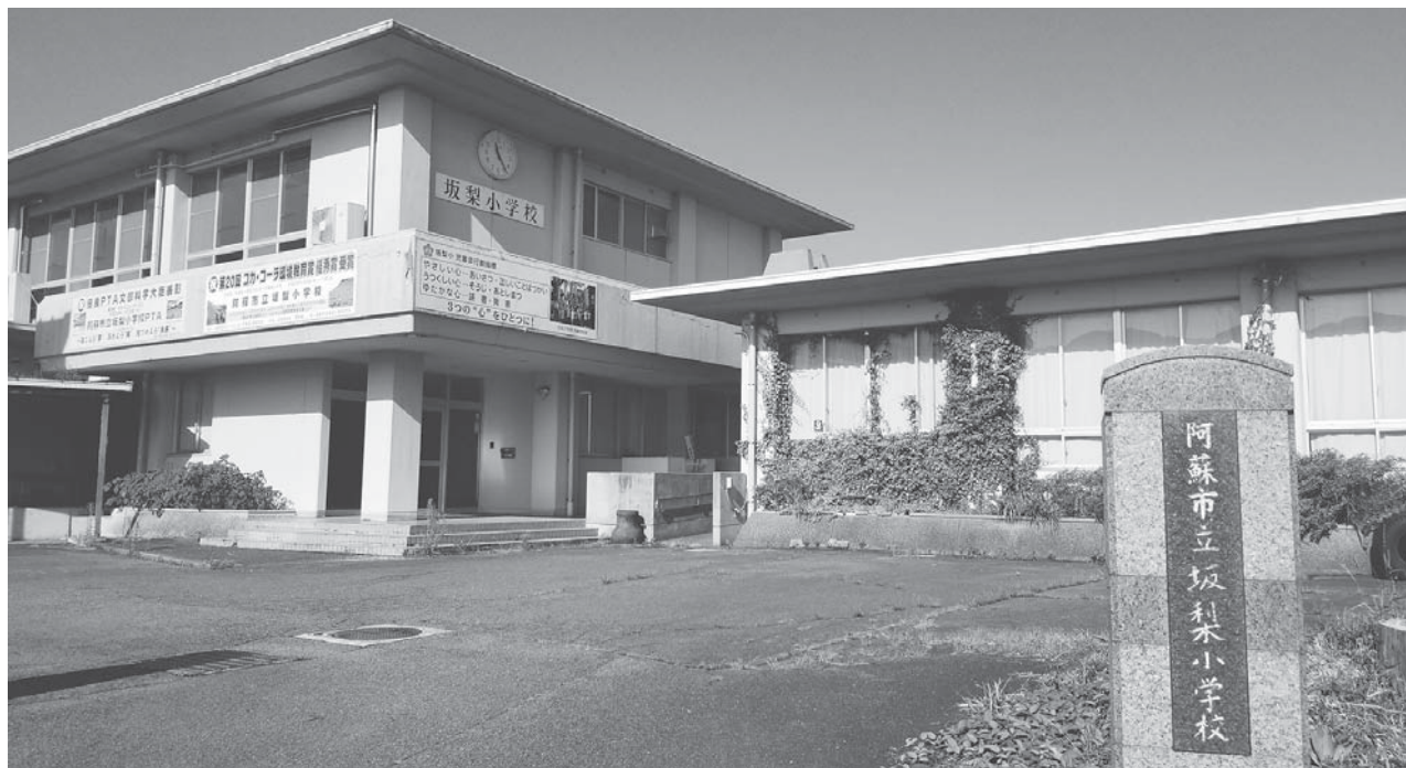
改修予定の旧坂梨小学校

また、別の 委員 より、「各学校施設の雨漏り工事については、実際雨漏りしているところの予算化なのか。年次計画で行っているのか。」との質疑があり、 教育課総務係長 から、「各学校からの修繕の要望などが出されていますが、目に見えて応急処置が必要な部分だけを計上してあります。」との答弁がありました。