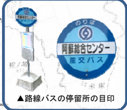
▲路線バスの停留所の目印