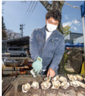
▲ 牡蠣を焼く三興建設の社員

3月27日、門前町商店街でかき祭が開かれ、広島県江田島産の牡蠣が提供されました。かき祭は同日の「お座敷商店街」と併せて実施され、多くの人が商店街に敷かれた畳の上で大粒の焼き牡蠣を楽しみました。