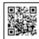
ひとり親世帯以外