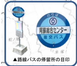
▲路線バスの停留所の目印