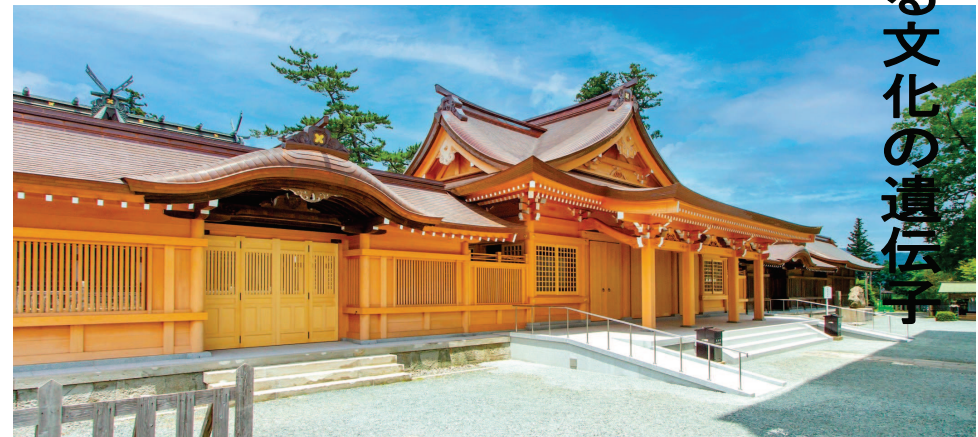
阿蘇神社 (国指定重要文化財)

阿蘇神社は、延喜式に記載される古社で、中世には肥後国一の宮として崇敬され、孝霊天皇9年に初代阿蘇国造の連瓶玉命により創建されたと伝えられます。阿蘇開拓の祖神、健甕龍命をはじめ12神をまつており、末社は全国に500社を超えます。平成19年に一の神殿・二の神殿・三の神殿・楼門・神幸門・還御門の計6棟が国の重要文化財に指定されました。平成28年熊本地震では、楼門が倒壊するなど重要文化財に被害が出たほか、拜殿などその他の歴史的建造物にも大きな被害が発生しました。現在復旧工事が進められています。