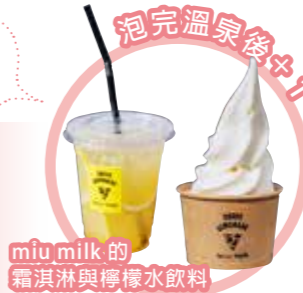
miu milk 的霜淇淋與檸檬水飲料