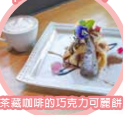
茶藏咖啡的巧克力可麗餅