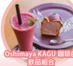
Oshimaya KAGU 咖啡的飲品組合