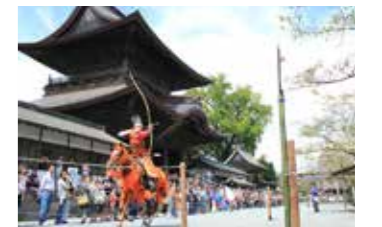
▲御田祭。伴隨眾神明的是全身穿上白色裝束的女性（宇奈利）等，約 200 人的隊伍。 ▲撒火祭神儀式中，可以看到火圈交疊的樣子，非常壯觀。 ▲田實祭中，會舉行還願相撲及流鏑馬（騎馬射箭）作為敬奉活動的祭神儀式。