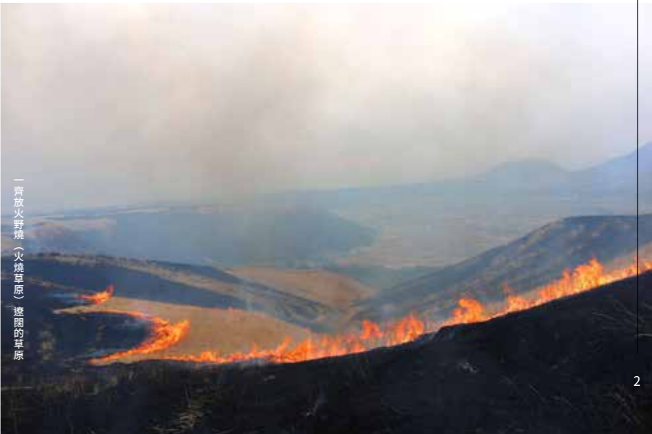
一齊放火野燒（火燒草原）遼闊的草原

阿蘇草原歷經千年以上，經由人為持續不斷地進行野燒（火燒草原）、放牧牛馬及割草的循環被守護著。野燒（火燒草原）是藉由放火燒草原，防止森林化，對於驅除動植物的病蟲害等有著很大的作用。野燒（火燒草原）作業時需要很多人手，但是因為畜產農家的減少及高齡化等的因素，變得很難存續下去。今後，要維持草原的狀態，就必須要有義工，還有更多的人員的了解及支持。