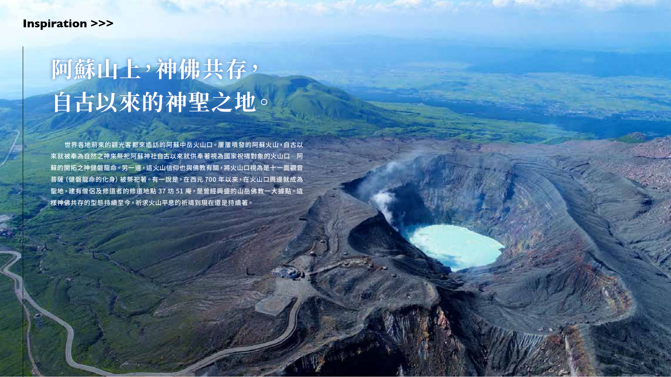
煙霧冉冉升起的壯觀阿蘇火山。被稱為御池參拜的登山口，也被列為信仰的對象。

世界各地前來的觀光客都來造訪的阿蘇中岳火山口。屢屢噴發的阿蘇火山，自古以來就被奉為自然之神來祭祀阿蘇神社自古以來就供奉著視為國家祝禱對象的火山口—阿蘇的開拓之神健甕龍命。另一邊，這火山信仰也與佛教有關，將火山口視為是十一面觀音菩薩（健甕龍命的化身）被祭祀著。有一說是，在西元 700 年以來，在火山口周邊就成為聖地，建有僧侶及修道者的修道地點 37 坊 51 庵，是曾經興盛的山岳佛教一大據點。這樣神佛共存的型態持續至今，祈求火山平息的祈禱到現在還是持續著。