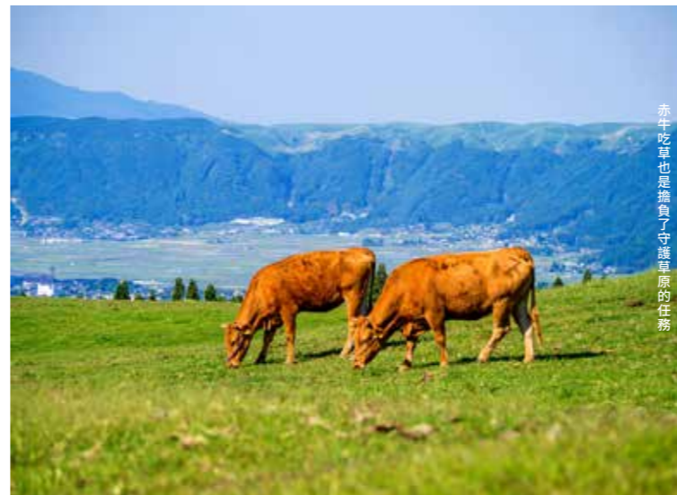
赤牛吃草也是擔負了守護草原的任務

草原上的雨水蒸發量少，比起森林，它有更好的儲存地下水功能。滲入阿蘇草原的地下水，成為了白川及筑後川等 6 條河流的源流，支撐起福岡市及熊本市等的生活用水。