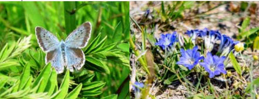
瀕臨絕種的大環斑小灰蝶

在阿蘇草原上能看到約有 600 種的植物，包含稀有品種。孕育出野生動物及鳥類、昆蟲能棲息的環境，有著多樣的蝴蝶棲息於此，有著「蝴蝶樂園」的美譽。