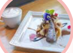
사쿠라 카페의 쇼콜라 크레이프