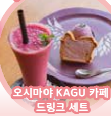
오시마야 KAGU 카페 드링크 세트

특수곡식인 식감의 천사 or 약마의 빵, 아소 천연 아이스크림, 음료 3종 세트