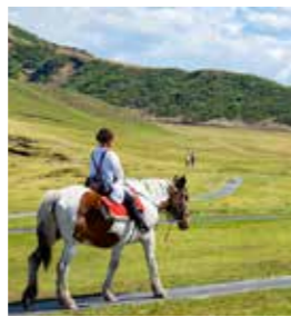
구사센리가하마에서는 승마 체험도 가능.