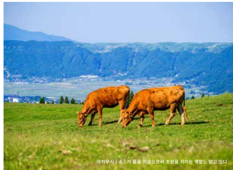
이카우시(소)가 풀을 먹음으로써 초원을 지키는 역할도 받고 있다.

초원은 비가 증발하는 양이 적고, 삼림보다도 땅속에 물을 저장하는 능력이 높다고 합니다. 아소 초원으로 스며든 지하수는 시라카와 강이나 지쿠고가와 강 등 6대 강의 원류가 되어, 후쿠오카시나 구마모토시 등의 생활수가 되고 있습니다.