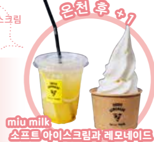
miu milk 소프트 아이스크림과 레모네이드