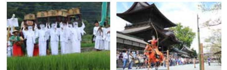
▲ 온다 마츠리 (御田祭). 신들을 모시고 있는 것은 천신 흰 옷을 입은 여성 (우나리) 등 약 200 명의 행렬입니다. ▲ 히후리신지에서는 불고리가 걸걸이 걸쳐 보이는 모습이 장관. ▲ 다노미사이 (田実祭) 에서는 봉납 행사로서 신사에게 기원하는 스모나 야부사마 (유적마) 가 열립니다.