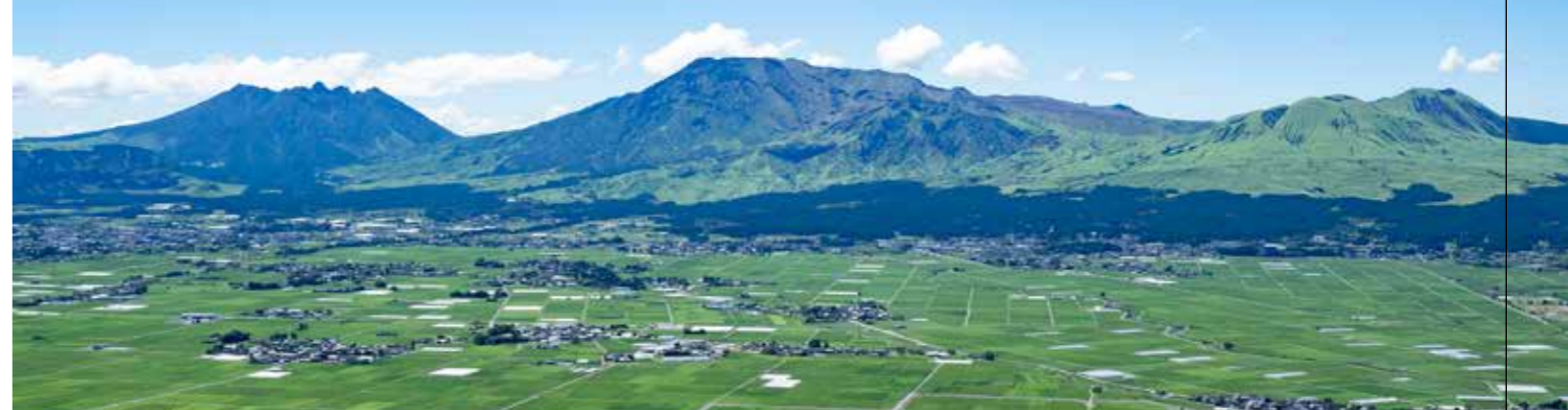
아소의 거리 풍경과 아소 오악을 한눈에 볼 수 있는 뷰 스폿

열반상의 실루엣을 한 아소 오악, 아소 골짜기를 가득 메운 운해. 칼데라에 둘러싸인 아소는, 절경의 보고입니다. 이곳에서만 볼 수 있는 경치를 꼭 보러 오세요.