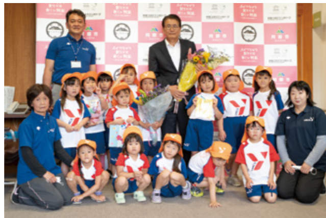
▲花束を贈った園児たち

6月第2日曜の「花の日」にあわせて熊本YMCA尾ヶ石保育園の年長児9人と年中児5人が、6月7日、市役所を訪れました。