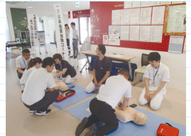
▲健康フェスタ 体験コーナー