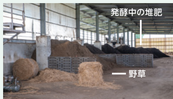
手前に置かれた野草が混ぜられる。

狩尾にある阿蘇市堆肥化センターは、契約した農家から家畜の糞を受け入れ、下水汚泥などと混ぜて堆肥を生産しています。そこには野草も混ぜられています。センターでは、年間におよそ5トンの野草を「草原再生オペレーター組合」から購入しています。