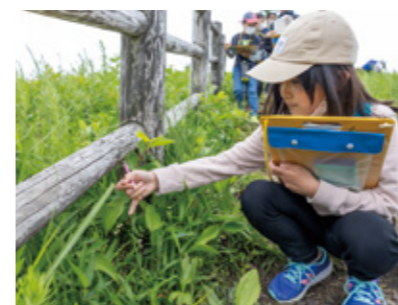
▲スズランを観察する児童

5月25日、波野小の児童36人が、スズラン自生地でスズランやシライトソウなどさまざまな種類の植物を観察しました。