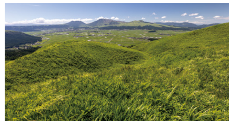
緑の草原は阿蘇を代表する景観。人の手によって守られてきた。

野草堆肥の使用は、草原を守ることにつながるとされています。野草を刈り取ることで、草原の維持に欠かせない野焼き時の炎が小さくなり、より安全に野焼きを行うことができます。背丈