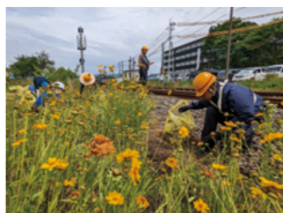
▲阿蘇駅周辺で黄色い花を駆除

6月5日、阿蘇の希少植物や生態系を守るため、環境省や自然公園財団などの職員11人がオオキンケイギクの駆除活動を行いました。