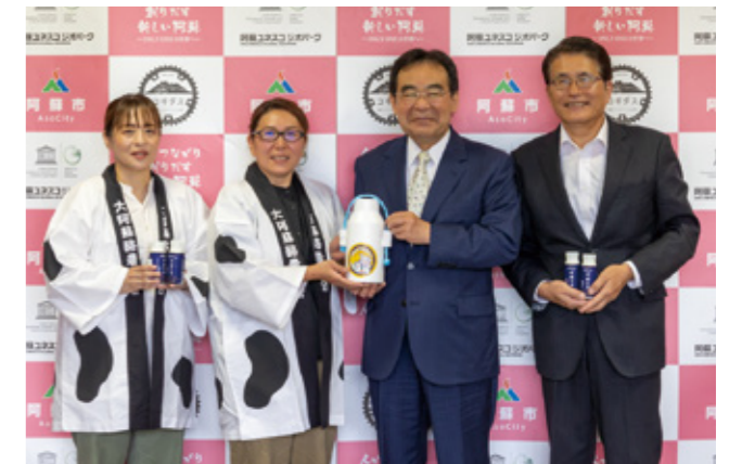
▲父の日に合わせて牛乳が贈られた

6月5日、大阿蘇酪農業協同組合女性部が父の日に合わせて市役所を訪れ、佐藤市長に牛乳を贈りました。