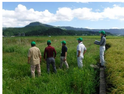
農地パトロールを実施する委員（内牧地区）

8月に阿蘇市管内の荒れている農地状況を調査するために農地パトロールを実施しました。この活動は毎年8月と2月に行っており、新たに発見された遊休農地もあり、今後も遊休農地の発生防止と解消に努めていきます。