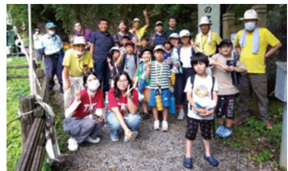
「手野の名水でそうめん流し」などのイベントに参加