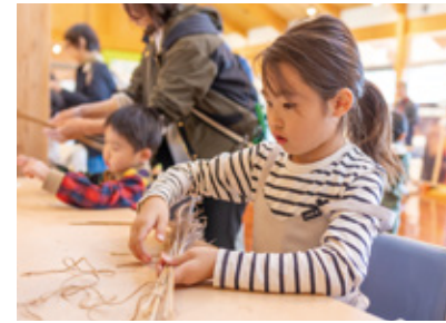
▲スキのほうき作りを体験

体験活動や食を通じて草原に親しんでもらうイベント「ASO草原フェスティバル」が11月25日、草原保全活動センターでありました。市や環境省、公益財団法人阿蘇グリーンストックなど8団体からなる実行委員会が主催。