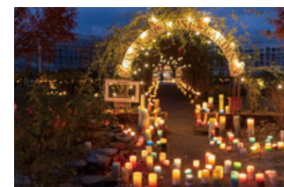
▲キャンドルで彩られたバラ園

内牧1区の住民からなる新町クラブは内牧1区公民館の周辺にイルミネーションを設置。地域を賑やかにしたいと毎年実施しています。1月13日(土)まで。