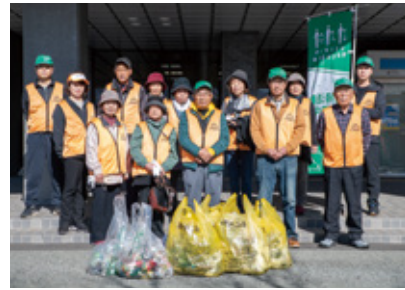
▲清掃を行ったたばこ組合のメンバー