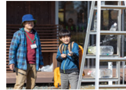
▲野焼きで使用する放水器具を体験

リース作りや、野草から抽出した染料を使った草木染めなどの体験活動には多くの親子連れが参