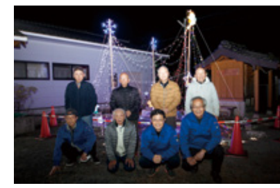
▲新町クラブのメンバー

12月1日から10日にかけてASO MILK FACTORYで阿蘇キャンドルナイトが開催。バラ園が5,000本のキャンドルで彩られ、約5,000人が訪れました。