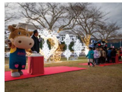
▲イルミネーション点灯の瞬間

12月1日、内牧の市総合センター多目的広場で「恋人たちのイルミネーション」が始まりました。LEDで彩られたハートや動物のオブジェが訪れる人を楽しませています。2月29日(木)まで。