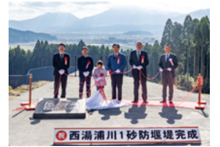
▲銘板を披露した関係者

11月19日、西湯浦川1砂防堰堤の完成お披露目会が現地で開催され、工事関係者や地元住民が完成を祝いました。