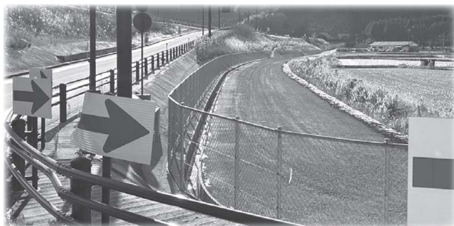
認定された市道路線(車帰地区)

以上のような審査を経た結果 本案は原案のとおり可決すべき ものと決定いたしました。