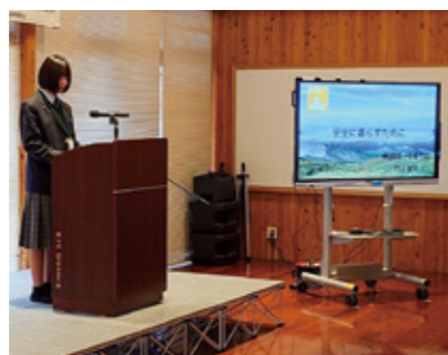
▲プレゼンをする生徒