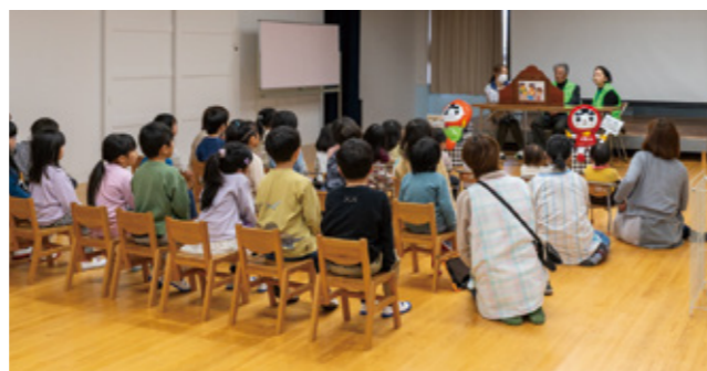
▲園児たちに紙芝居を読み聞かせる人権擁護委員ら

1月23日、阿蘇大津人権擁護委員協議会が坂梨保育園で園児らを対象とした人権教室を初めて開催しました。友達の気持ちを考えられるようになることや、思いやりの心を育み、いじめを生まない環境をつくることを目的として協議会が計画しました。