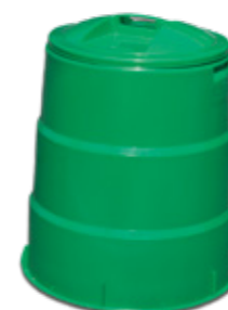
生ごみ処理容器のイメージ▶