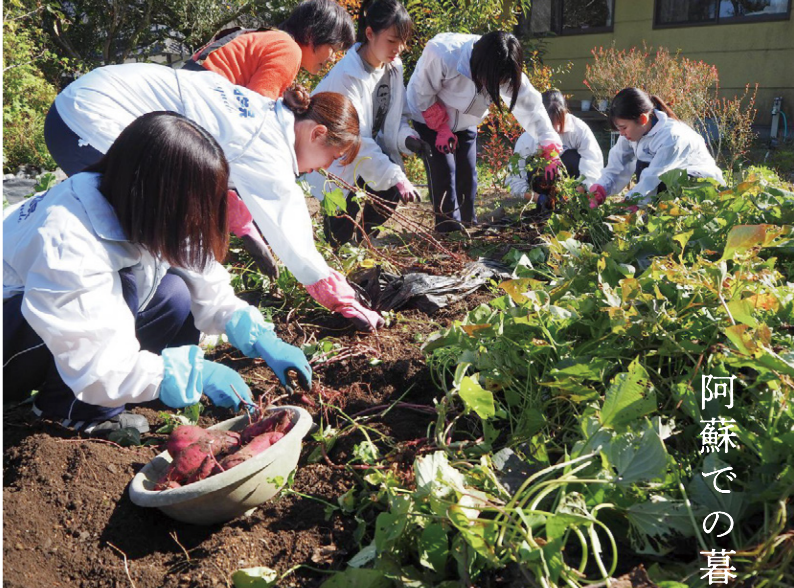
▲サツマイモ収穫体験をする生徒たち

A 農家でなくても受け入れることができます。 阿蘇ファームステイは、農業体験ではなく農村でのくらしを体験することなので、農家でなくても問題ありません。