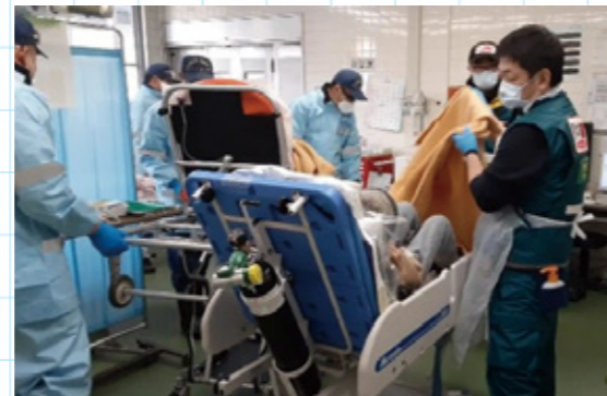
▲搬送されてきた患者への対応