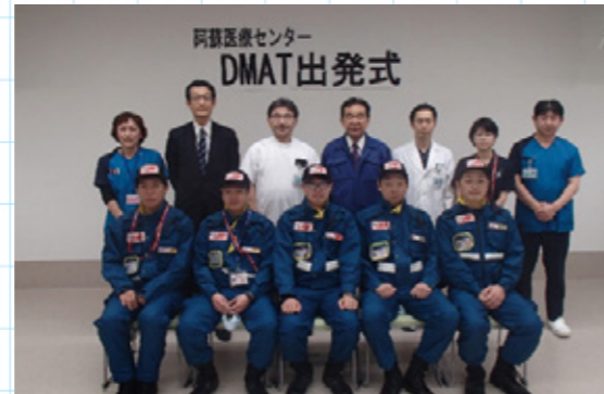
▲阿蘇医療センター DMAT 出発式