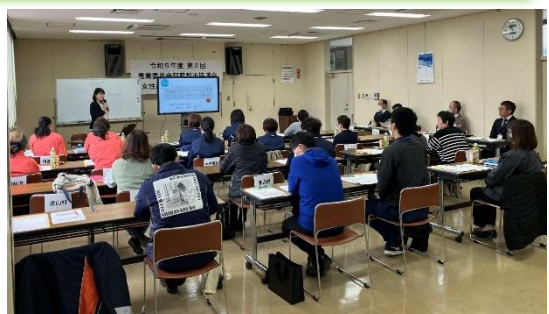
（郡市女性農業委員研修会の様子）