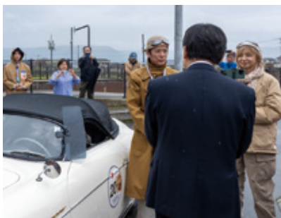
▲ 佐藤市長の出迎えを受ける唐沢寿明さん(左) チェント・ミリアに参加した車(右)

4月6日、熊本地震の被災地をクラシックカーで巡り地域を盛り上げるイベント「GO!GO!ラリーin熊本」が開催されました。俳優の唐沢寿明さんが発起人として企画。1926年から1974年に製造された106台が参加し、熊本市をスタート