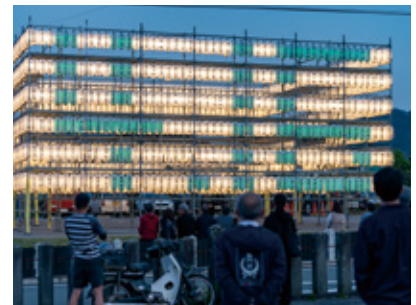
▲ 4.16の文字が浮かび上がった

藤市長が「熊本地震の教訓を風化させることなく市民の皆さま方と心を1つにして引き続き防災・減災に取り組んでいく」とあいさつし、防災への誓いを新たにしました。