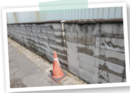
▲危険なブロック塀